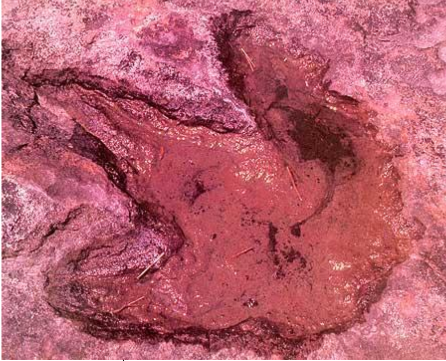
รอยเท้าไดโนเสาร์ ที่ภูหลวง

-เขตรักษาพันธุ์สัตว์ป่าภูหลวง จ.เลย : อาณาจักรพืชพรรณไม้แห่งนี้มีของดีในระดับอันซีนไทยแลนด์ชุกชอนอยู่นั่นก็คือ รอยเท้าไดโนเสาร์ร่วม 15 รอย ที่มีทั้งรอยที่เลือนรางและรอยที่ชัดเจนและสมบูรณ์มากที่สุดในเมืองไทย เป็นรอยเท้า 3 นิ้วมี(รอย)เล็บแหลมคล้ายรอยเท้าคน เป็นร่องลึกบุ๋มลงไปในพื้นที่มองเห็นชัดเจน มีขนาดกว้าง 30 เซนติเมตร ยาว 35 เซนติเมตร ซึ่งผู้เชี่ยวชาญด้านไดโนเสาร์จากเมืองนอกวิเคราะห์ว่า ไดโนเสาร์ตัวนี้น่าจะสูงประมาณ 1.8 เมตร และเดินเร็วประมาณ 8 กม.ต่อชั่วโมง หรือเร็วกว่าคนประมาณ 2 เท่า