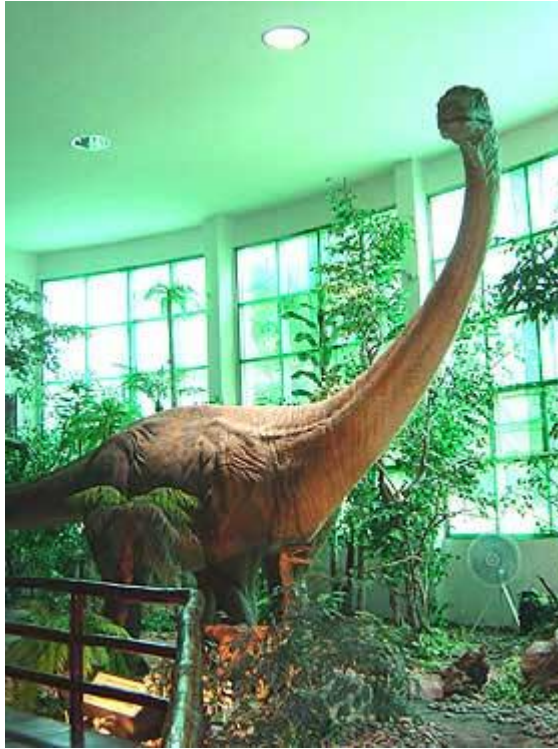
หุ่นจำลองภูเวียงโกซอร์สไดโนเสาร์ชนิดแรกที่ค้นพบในเมืองไทย

สำหรับการขุดค้นหาซากดึกดำบรรพ์ในประเทศไทย เริ่มมาตั้งแต่ปี พ.ศ. 2519 มีรายงานการขุดพบซากกระดูกไดโนเสาร์อย่างเป็นทางการครั้งแรก ที่ อ.ภูเวียง จ.ขอนแก่น จากนั้นได้มีการขุดค้นซากฟอสซิลไดโนเสาร์ การศึกษาค้นคว้าเกี่ยวกับไดโนเสาร์ในบ้านเราเรื่อยมา