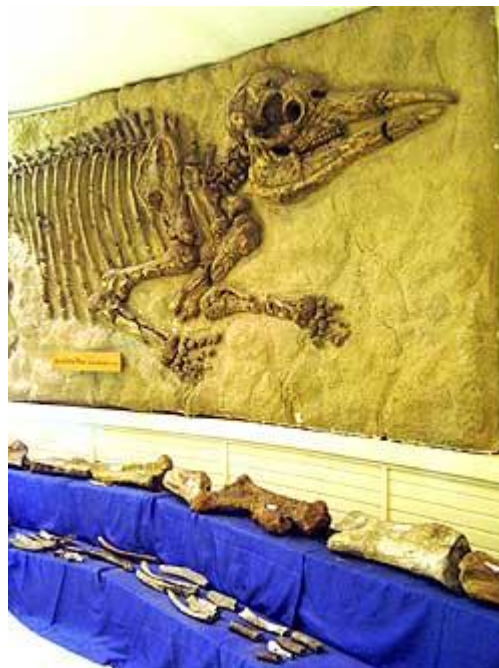
ฟอสซิลไดโนเสาร์ที่พิพิธภัณฑ์ไม้กลายเป็นหิน

สำหรับการชมไดโนเสาร์ที่นี้ถึงแม้จะเป็นหุ่นจำลอง ของที่หาเลียนแบบขึ้นมา แต่เราต้องดูแลตามืออย่าต้อง อย่าไปแตะ สัมผัส ลูบคลำ เพื่อไม่ให้ของดีที่ทางพิพิธภัณฑ์ตั้งใจทำมาชำรุด เสียหาย เพราะนั่นถือเป็นการบ่อนทำลายการท่องเที่ยวไทยอีกทางหนึ่ง