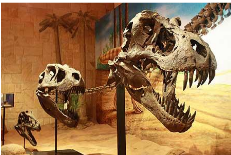
ส่วนจัดแสดงหัวกะโหลกไดโนเสาร์ ที่พิพิธภัณฑ์สิรินธร

ภายในพิพิธภัณฑ์แบ่งเป็นโซนต่างๆ นำเสนอเรื่องราวตั้งแต่กำเนิดโลกและจักรวาล ฟูฟั้นมาสู่ความเปลี่ยนแปลงของโลกในยุคต่างๆ ก่อนส่งต่อเข้าสู่โซน(ยุค)ไดโนเสาร์ครองโลก ที่จัดแสดงเรื่องราวต่างๆเกี่ยวกับไดโนเสาร์อย่างละเอียด ด้วยเทคนิคอันน่าตื่นตาตื่นใจ ทั้งแสง สี เสียง และหุ่นจำลองทั้งโครงกระดูก ซากฟอสซิล ป่าดึกดำบรรพ์ และหุ่นจำลองไดโนเสาร์เสมือนจริงที่ทำออกมาได้อย่างน่าทึ่ง