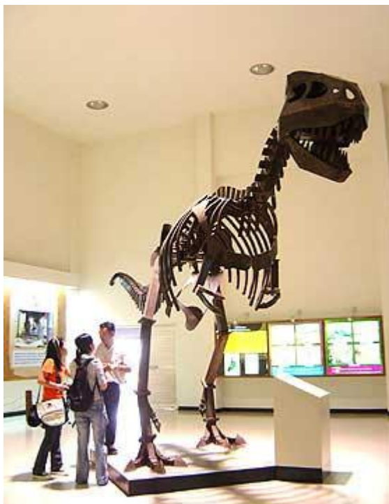
หุ่นจำลองโครงกระดูกไดโนเสาร์ ในพิพิธภัณฑ์ไดโนเสาร์ภูเวียง

ปัจจุบันแวดวงการศึกษาไดโนเสาร์บ้านเราไม่ไปเพียงไปไกลในระดับโลกเท่านั้น หากแต่แหล่งค้นพบ แหล่งขุดค้น สถานที่ค้นพบซากฟอสซิลและร่องรอยไดโนเสาร์หลายๆแห่งในภาคอีสานยังถูกพัฒนาเป็นแหล่งท่องเที่ยวเรียนรู้ที่น่าสนใจไม่น้อยเลย โดยเฉพาะที่ภูเวียง จ.ขอนแก่น กับ ที่ภูกุ่มข้าว จ.กาฬสินธุ์