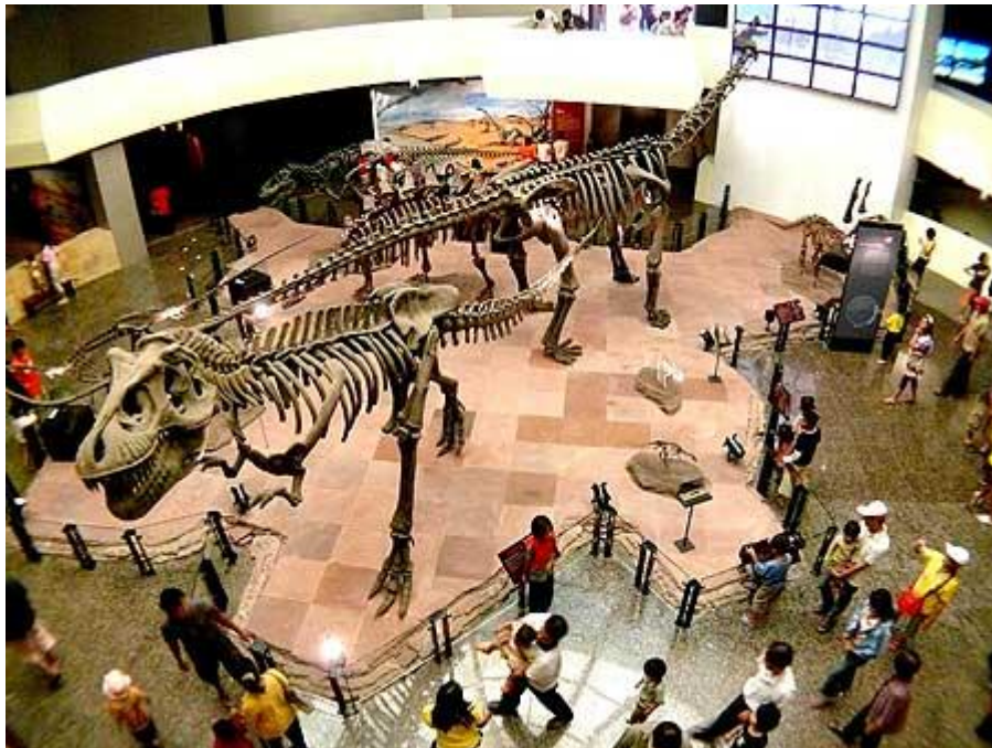
โถงไดโนเสาร์ ไฮไลท์แห่งพิพิธภัณฑ์สิรินธร

เดิมซากไดโนเสาร์จะเก็บไว้ใกล้ๆกับหลุมขุดค้นภายในวัดสักกะวัน แต่ด้วยความที่มันมีมากและจำเป็นต้องให้ผู้เชี่ยวชาญดูแลรักษา จึงมีการจัดสร้าง“พิพิธภัณฑ์สิรินธร”ขึ้นที่ภูมู่ข้าว ใกล้ๆกับแหล่งขุดค้น เพื่อใช้เป็นสถานที่เก็บซากฟอสซิล สถานที่จัดแสดงด้านไดโนเสาร์ ศูนย์วิจัย รวมถึงเป็นแหล่งท่องเที่ยวเรียนรู้ ที่ภายหลังการเปิดอย่างเต็มรูปแบบของพิพิธภัณฑ์แห่งนี้ในปี พ.ศ. 2550 ผู้คนต่างก็หลั่งไหลมาตามรอยไดโนเสาร์ที่กาฬสินธุ์กันไม่ได้ขาด